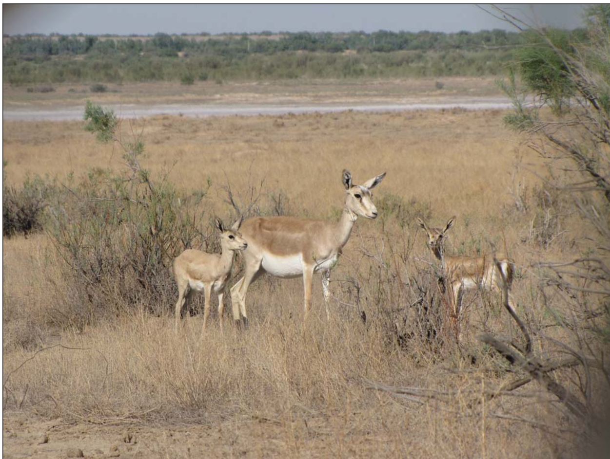
Самка джейрана с двумя детенышами месячного возраста.

раны только проходили. На них мы записывали крики от нетерриториальных взрослых и молодых самцов. Иногда молодые самцы (судя по размерам рогов, от полутора до двух с половиной лет), оттягивали гортань, направляя эти демонстрации самкам, но при этом не кричали.