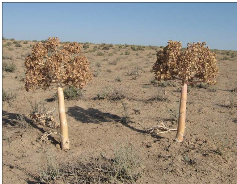
Засохшие прошлогодние ферулы.

были закуплены для всех участников экспедиции в отделе неликвидов большого магазина тканей. Невозмутимо выслушав пожелание купить занавески из ткани грязно-болотного цвета, из синтетики и самые дешевые,