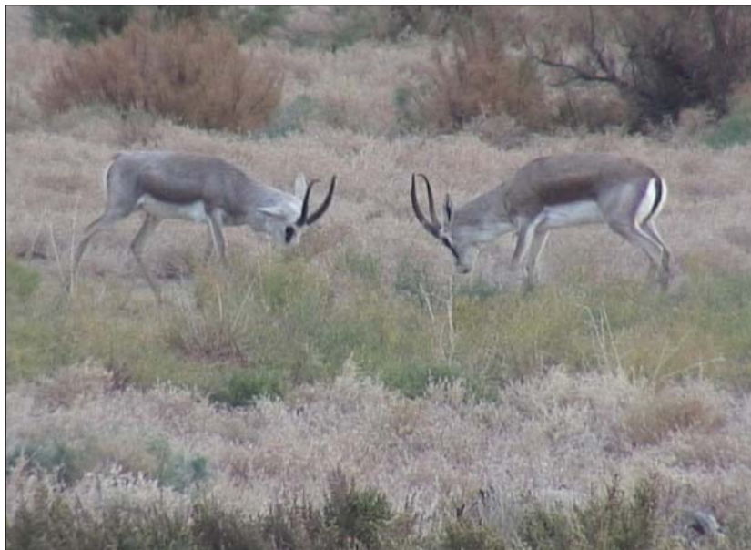
На границе своих гонных территорий два взрослых самца джейрана выясняют, кто из них сильнее.

чал не слишком далеко от наблюдателя, хотя бы метрах в 50. Дистанцию до животных оценивали уже после выхода из укрытия, по расстоянию до гонной группы. Неожиданно увидев перед собой человека, животные не убегали, а удивленно стояли и смотрели, как он медленно снимает с себя кучу одежды, делает записи в дневник и, наконец, пакует все в огромный рюкзак. Только при подъеме в полный рост и передвижении человека газели начинали отбегать.