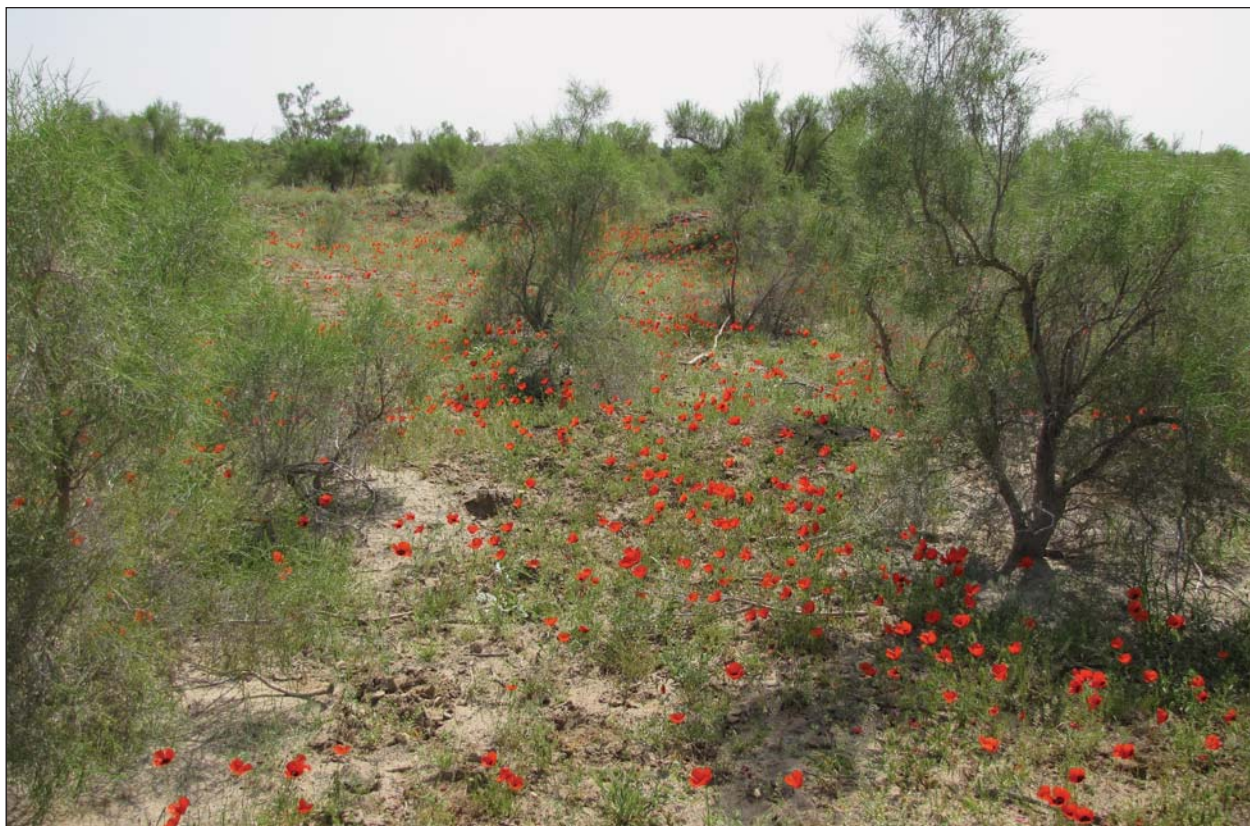
Маки в саксауловой роще.

продавщица принесла именно то, что было нам нужно.